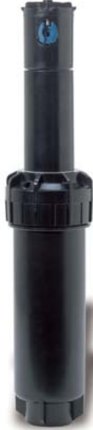
5000 Plus (PRS)